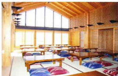
⑧休憩室 湯上がりの体をいたわるように自然とリラックスできます。