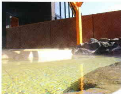
③寝湯 空を眺めながら、最高のリラックス気分を味わえます。