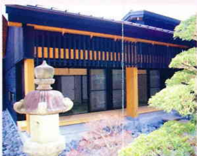
⑦個室休憩室(有料) 庭付きの個室でおくつろぎください。(要予約)TEL37-9265