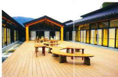
⑨多目的スペース 開放的なウッドスペースです。