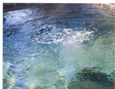
⑤人工炭酸泉 炭酸ガスの気泡が付着しポカポカと暖かさが持続します。