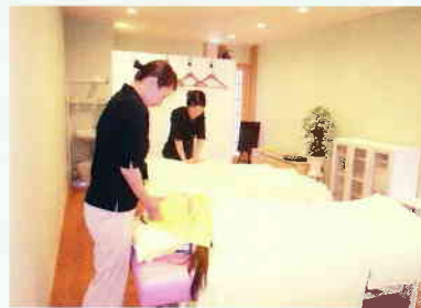
⑩リラクゼーション「koume」 ボディ・フェイス・ハンド・フットケアが受けられます。TEL32-9780