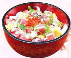
⑥お食事処「くつろぎ」 地元の素材を生かした季節の料理を堪能できるお食事処です。 TEL37-9265 ※写真は伊太里アン 梅ちらし寿司