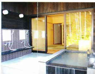
④貸切風呂(有料) 御影石やヒノキ風呂に浸かりながらゆったりとお過ごしください。