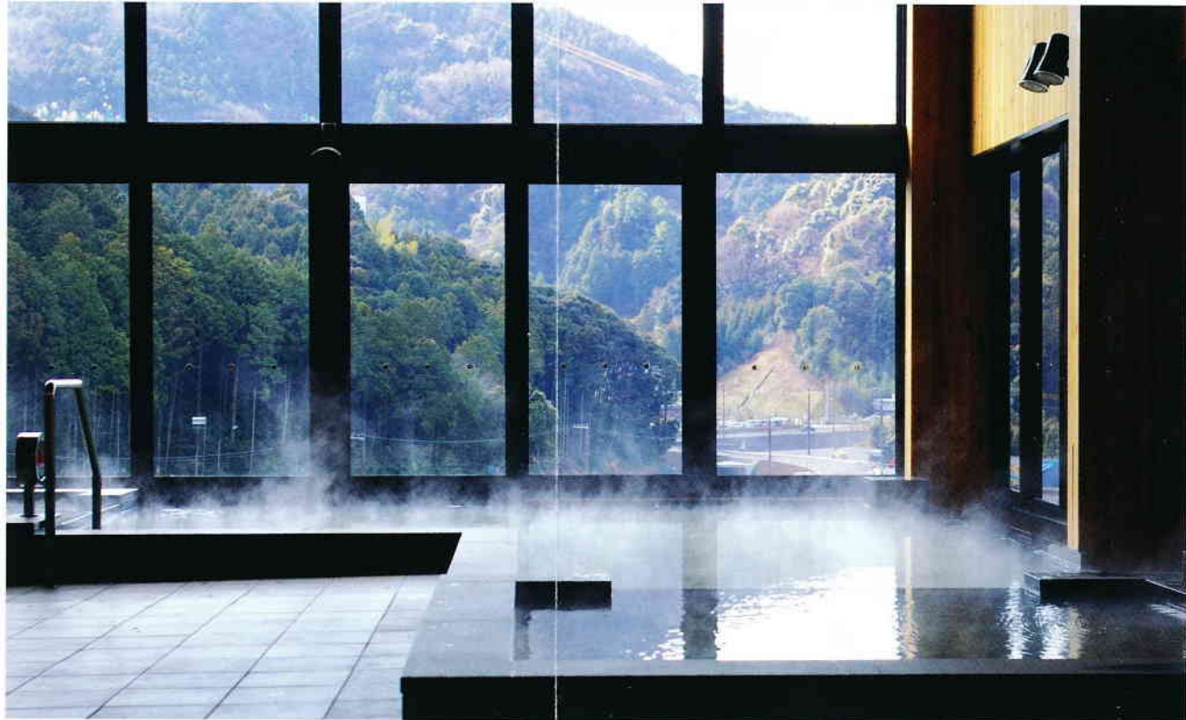
①内湯 内風呂には、ゆったりとした源泉循環風呂があります。